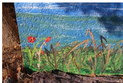
...et de coquelicots.