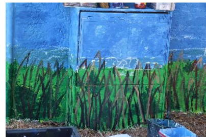
Peinture de roseaux...