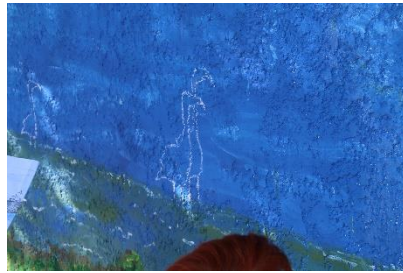
Ebauche à la craie des flamants roses.