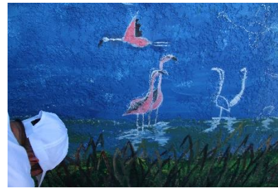
Dessin et peinture des flamants roses.