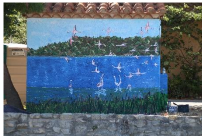
Peinture de tous les flamants roses.