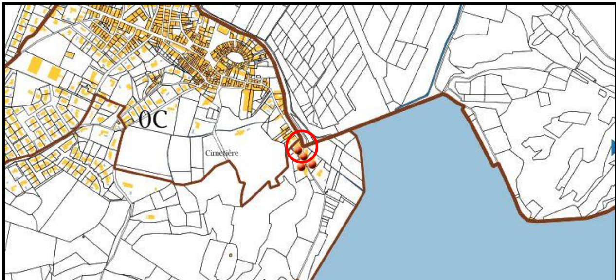
Plan cadastral du site