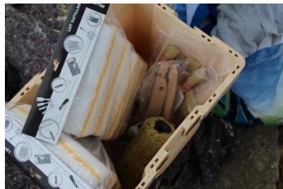
Explication de l'utilisation du matériel : rouleau mèche courte ou longue suivant les supports, brosse de pousse, brosse à réchampir ou brosse plate pour peindre.