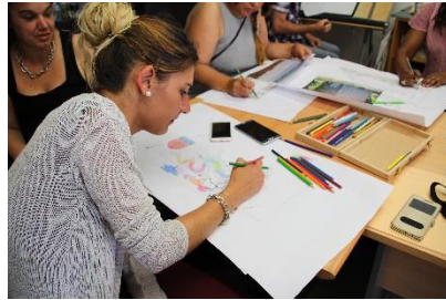
Cours sur la colorimétrie...

Les travaux ont démarré le 3 septembre 2018.