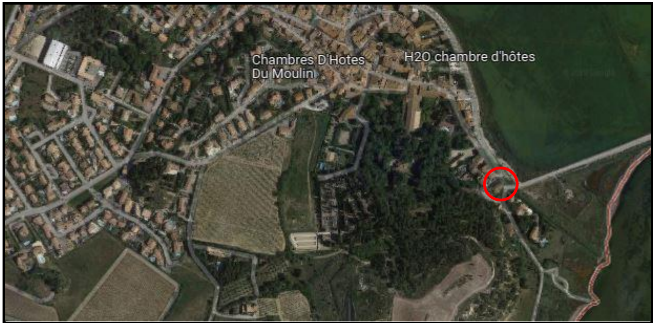
Vue aérienne du site (Google Maps)